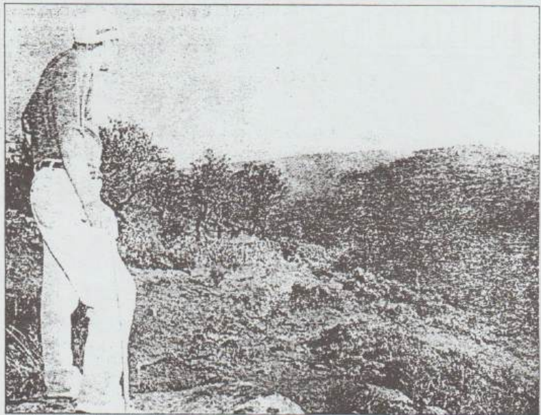
El fuego que se inició el miércoles en La Bouza se extendió ayer a Puerto Seguro, donde se quemaron unas 300 hectáreas